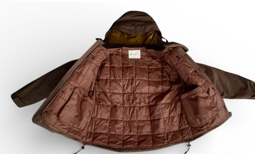
262GM-J1320SHELL M78PARKAとのセット PRICE:¥81,000+TAX

262GM-J1320 DUTCH M78 PARKAと脱着可能な 中綿キルトジャケット 中綿には3M社の"THINSULATE"を使用。 袖が脱着出来るコンバーチブルジャケット。 袖が外れて半袖になります。 半袖にして秋立ち上がりにはインナーにサーマルなどと相性がいいです。