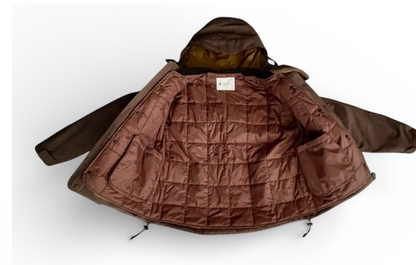
262GM-J1321LINER JACKETとのセット PRICE:¥81,000+TAX